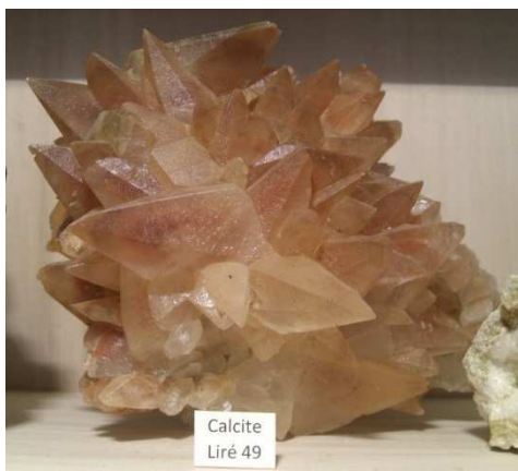
Calcites de Liré ( 49 )